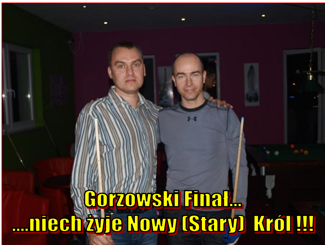
Gorzowski Finał... ...niech żyje Nowy (Stary) Król !!!