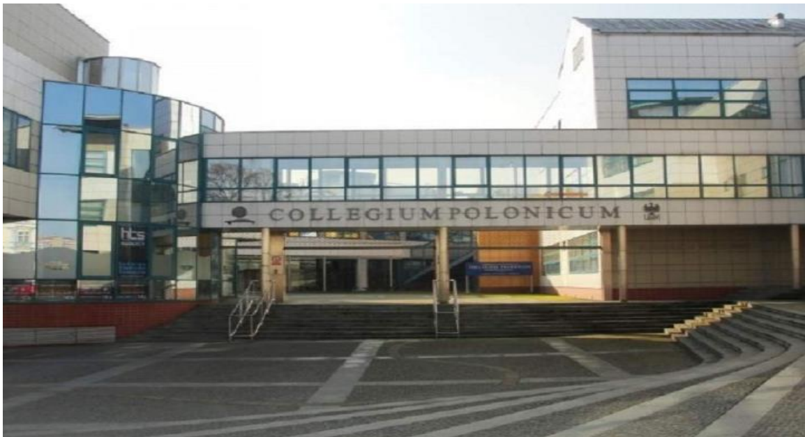
Collegium Polonicum w Słubicach