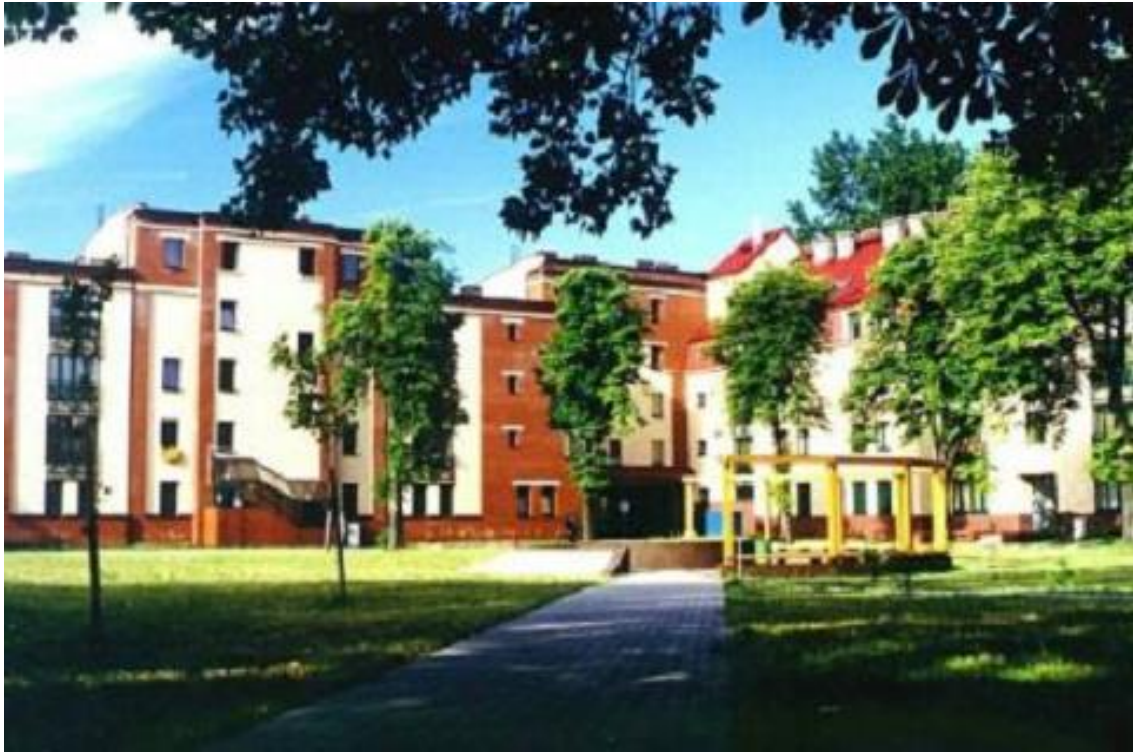
Osiedle Domów Studenckich w Słubicach