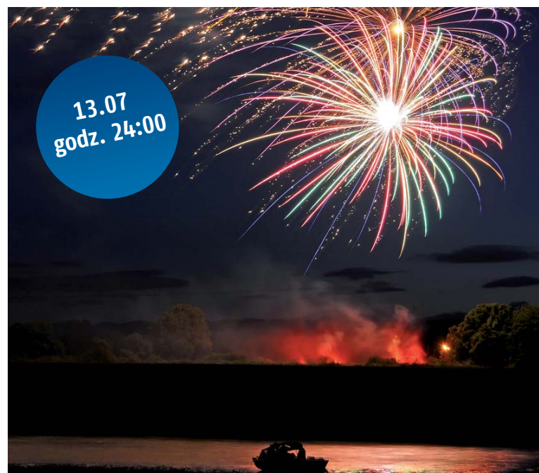
Zakończeniem pierwszego dnia imprezy tradycyjnie będzie spektakularny pokaz sztucznych ogni na Odrze.