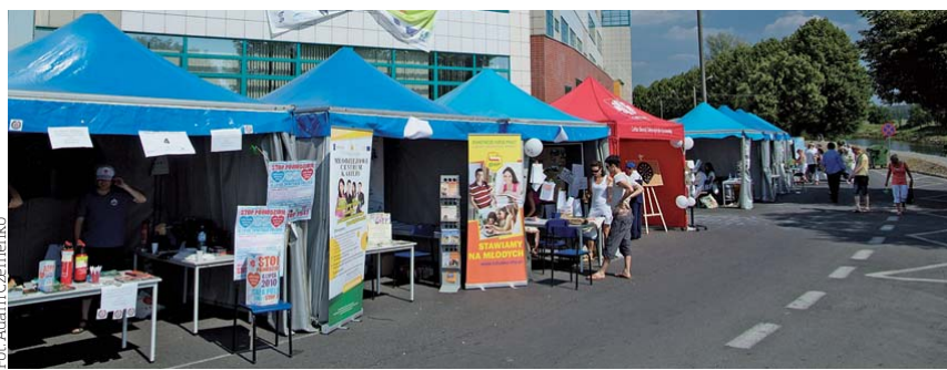
Piknik organizacji pozarządowych to doskonały sposób, żeby bliżej poznać ofertę społeczników.

łeczne i organizacje pozarządowe ze Słubic i Frankfurtu i okolicy, a także m.in. z Zielonej Góry, Świebodzina, Cybinki, Radzikowa, bo jednocześnie odbywać się będą Targi Aktywności Społecznej i Biznesu Społecznego. Ośrodek Wsparcia Ekonomii Społecznej w Zielonej Górze, który jest ich organizatorem, zaprasza m.in. na kiermasz wyjątkowego rękodzieła, warsztaty plastyczne i zielarskie i inne atrakcje.